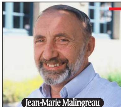
Représentant syndical CFTC Meuse-Haute-Marne

« Le CLIS doit permettre la comparaison entre les recherches menées en France et celles menées à l'étranger, ou entre celles menées par l'ANDRA et celles menées par des experts indépendants. C'est également un lieu de confrontation pour les opinions qui s'expriment sur la problématique des déchets radioactifs. Cela suppose une mission de vigilance mais aussi un rôle d'aiguillon, afin de lever des incertitudes ou d'approfondir des questions laissées en retrait ».